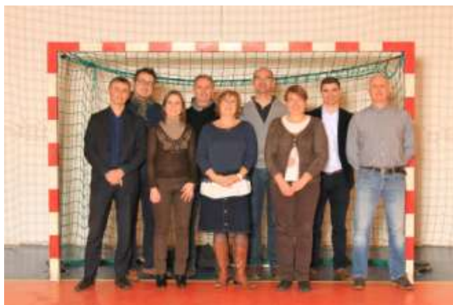
Les membres du bureau

Bonnes vacances à tous et à la rentrée en pleine forme !